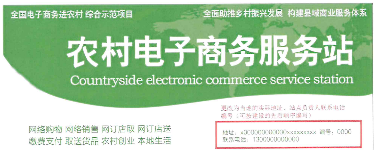
服务站门头参考图例

按照统一风格进行装修装饰，门头、牌匾特征醒目，统一标识“全国电子商务进农村综合示范项目”、新平县 XX 乡（镇）农村电子商务服务站、NO: XXXX 等相关内容。