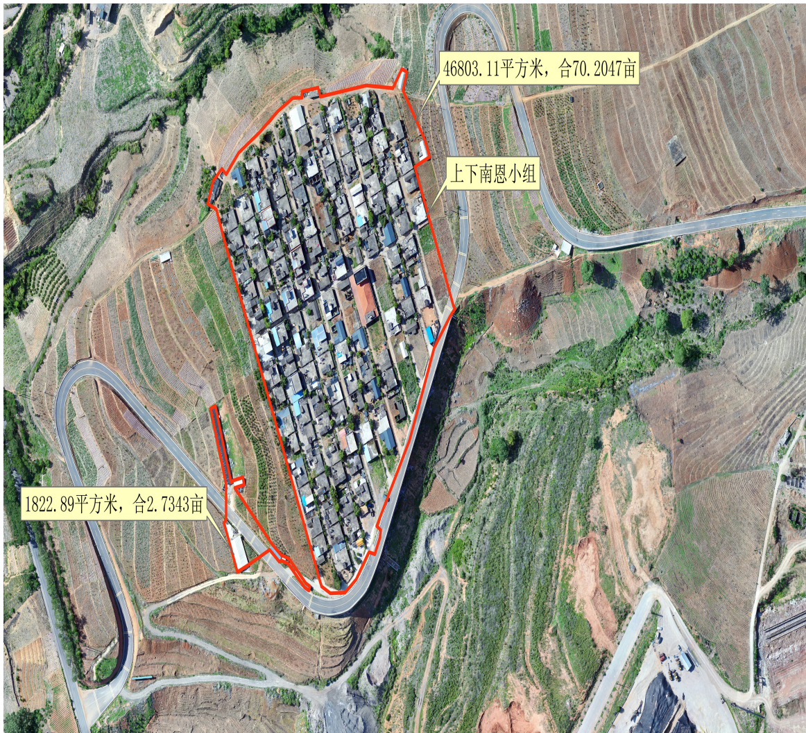
上下南恩小组影像图